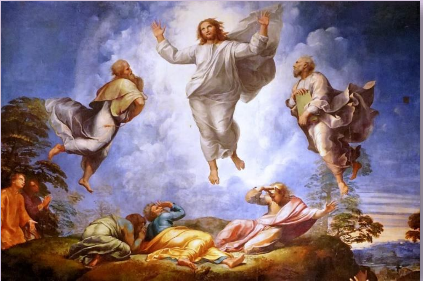
La Transfiguration (1518-1520) – Raphaël – Musées du Vatican

Mc 9, 7 (évangile du 2 ème dimanche de Carême)