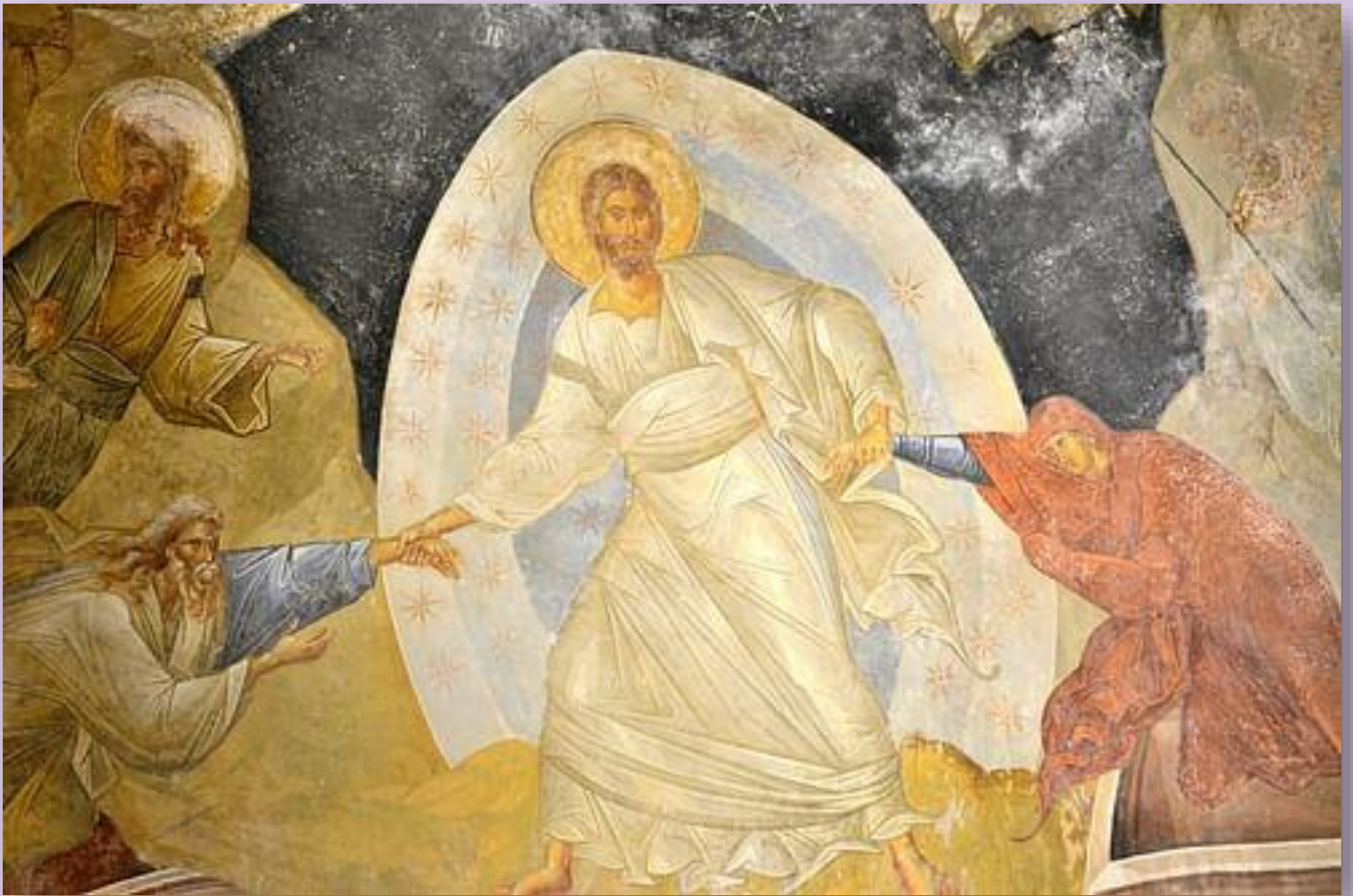
Fresque de la Résurrection (1315-1321), église Saint-Sauveur in Chora, Istanbul.

« Il vit, et il crut. Jusque-là, en effet, les disciples n'avaient pas compris que, selon l'Écriture, il fallait que Jésus ressuscite d'entre les morts. » (Jn 20, 8-9)