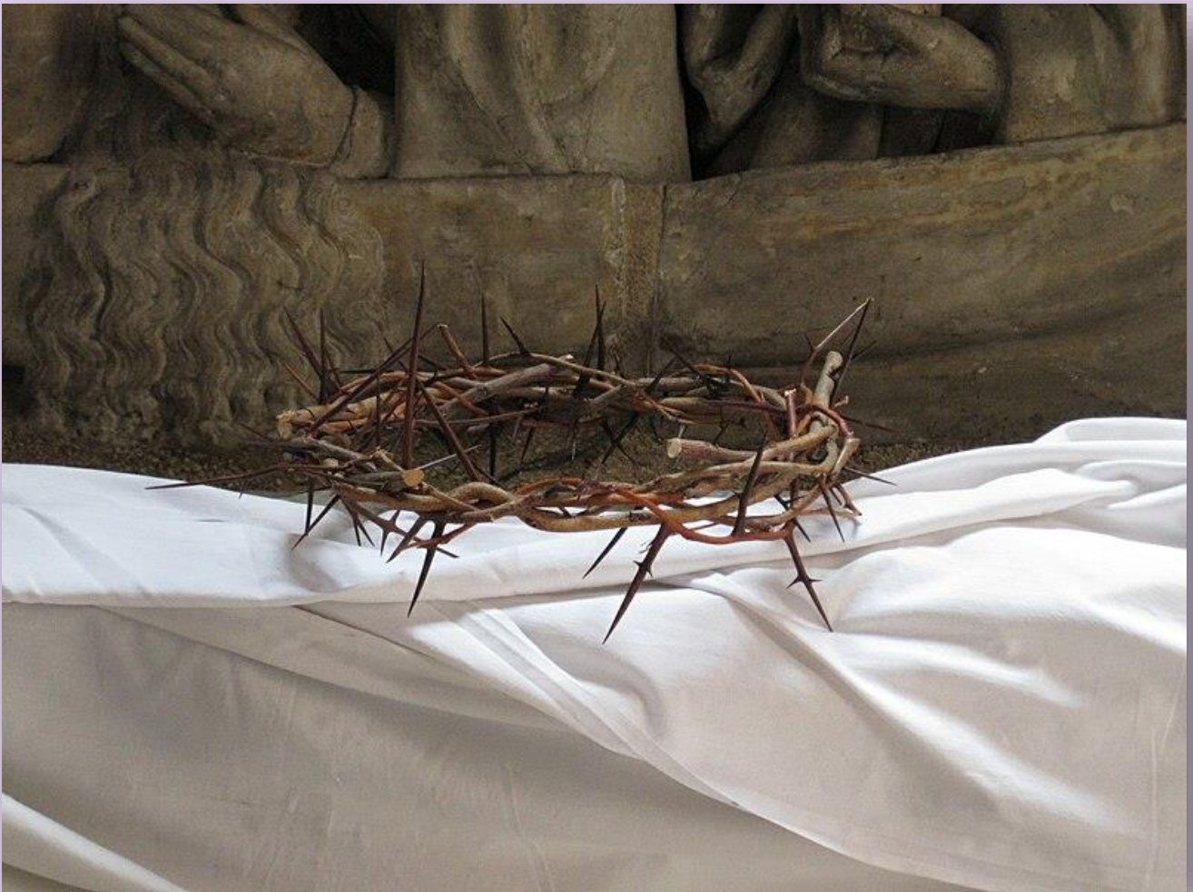
Couronne d'épine de l'église Saint-Michel de Dijon en Bourgogne

Jn 3, 16 (évangile du 4 ème dimanche de Carême)