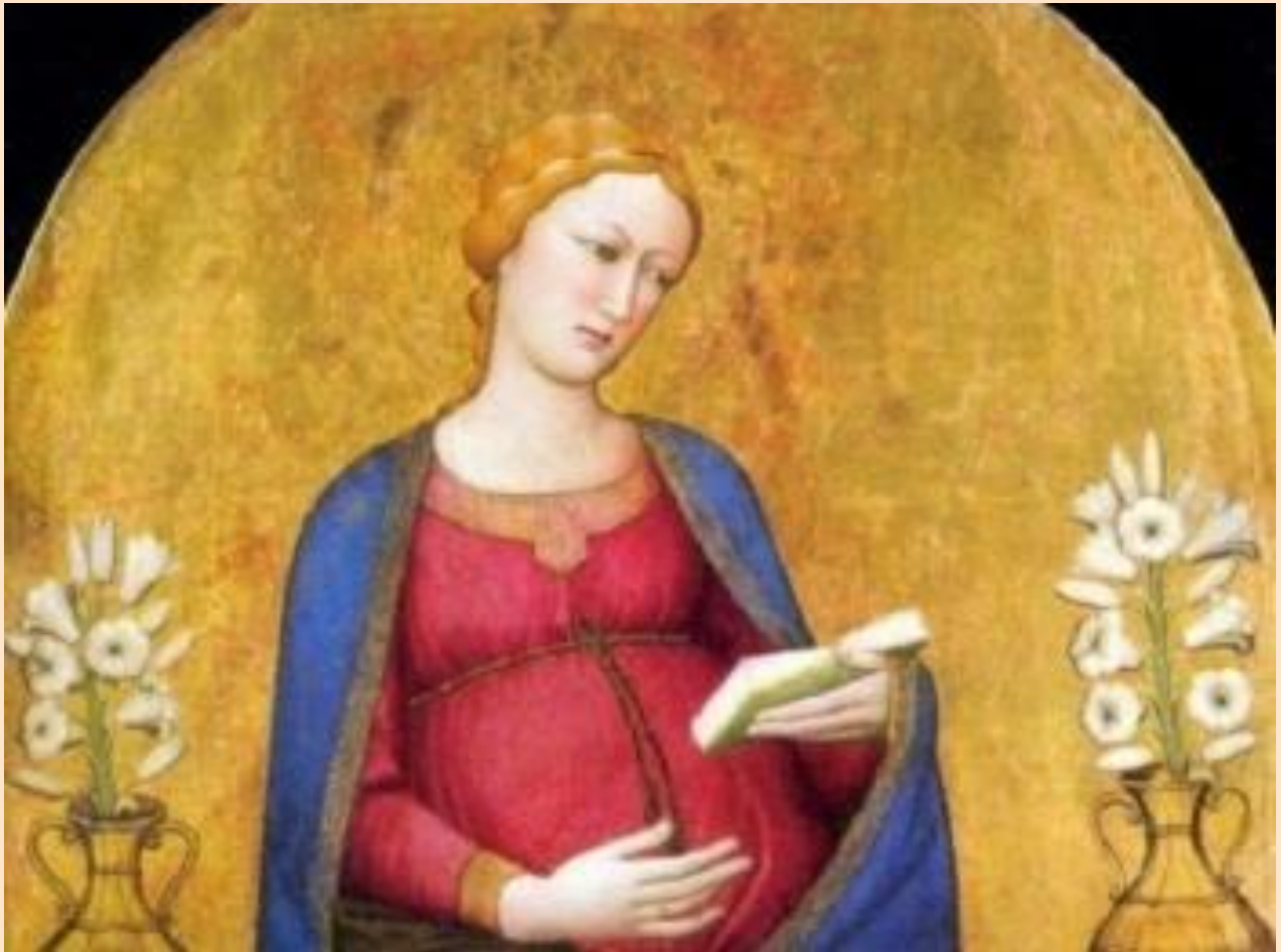
La Vierge de l'Avent, peinte par Antonio di Francesco da Venezia (XIV ème siècle)