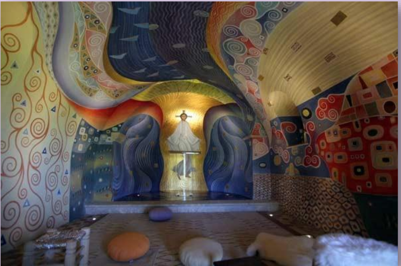
Chapelle orthodoxe de la Transfiguration - ENTRECASTEAUX (Var)

Mc 9, 7 (évangile du 2 ème dimanche de Carême)