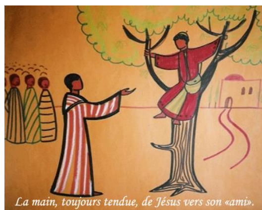
La main, toujours tendue, de Jésus vers son «ami».

Zachée debout devant le Seigneur, lui dit : « Écoute Maître, je vais donner la moitié de mes biens aux pauvres, et si j'ai pris trop d'argent à quelqu'un, je vais lui rendre quatre fois autant. » Jésus lui dit : « Aujourd'hui, le salut est entré dans cette maison, parce que tu es, toi aussi, un descendant d'Abraham. Car le Fils de l'homme est venu chercher et sauver ceux qui étaient perdus. »