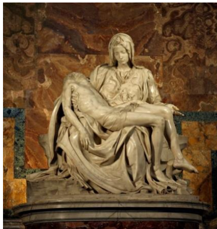
La Piéta de Michel Ange

Tout au long de la vie de Jésus, Marie est présente : l'Annonciation (25 mars), la naissance (25 décembre), la visite des Mages (janvier), l'enfance de Jésus, Jésus âgé de 12 ans est retrouvé au Temple en train d'enseigner, les noces de Cana, ..., Marie est là au pied de la Croix près de l'apôtre que Jésus aimait.