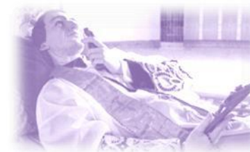
Châsse du Père de Montfort