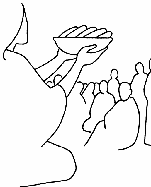
Illustration de J. F. Kieffer

Et avec ce qui reste, ils remplissent encore douze paniers.