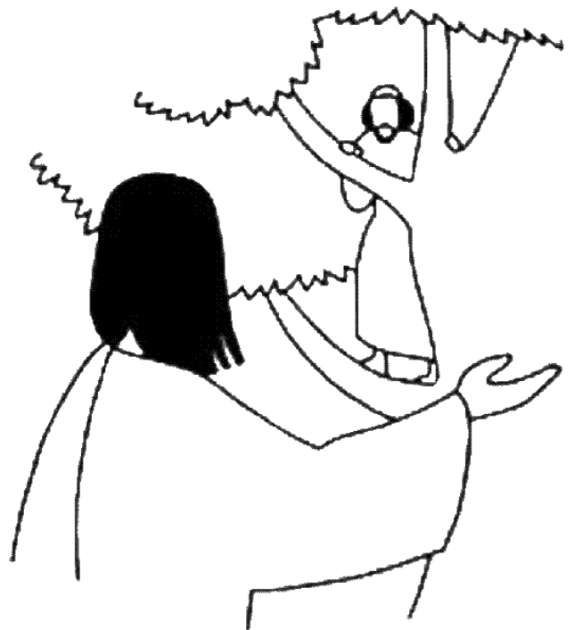
Illustration de J. F. Kieffer

- « Aujourd'hui, le salut est arrivé pour cette maison. En effet, je suis venu pour sauver ce qui était perdu. »