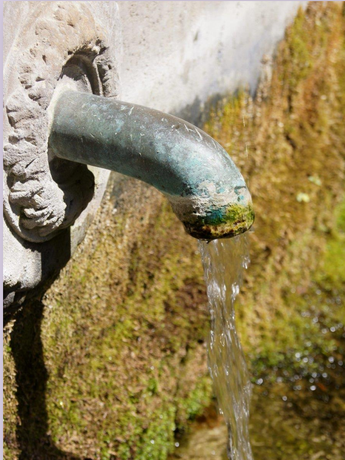
Fontaine des Quatre-Tias - FONTENAY-LE-COMTE

Accepter en nous une source qui renouvelle.