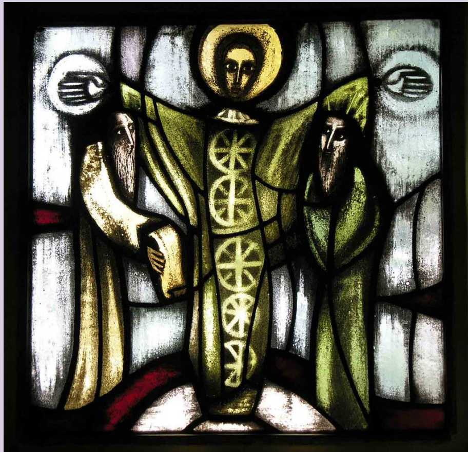
Vitrail de la Transfiguration, Eric de Saussure, église de la Réconciliation, TAIZÉ

Chercher, au plus profond de l'autre, la lumière divine.