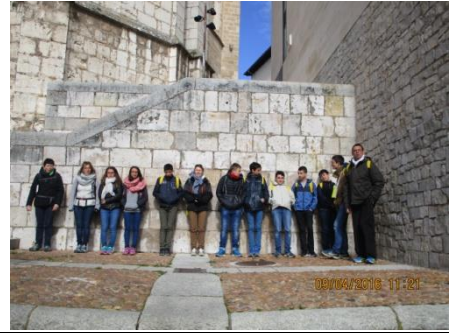
Des rencontres imprévues et des murs réchauffés par le soleil où il fait bon se poser...