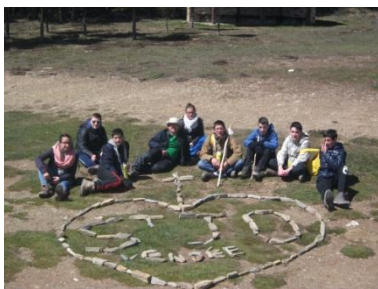
D'autres pour y déposer nos fardeaux (cailloux que chacun a rapporté de chez lui symbole de ce que chacun souhaite déposer au pied de la croix)