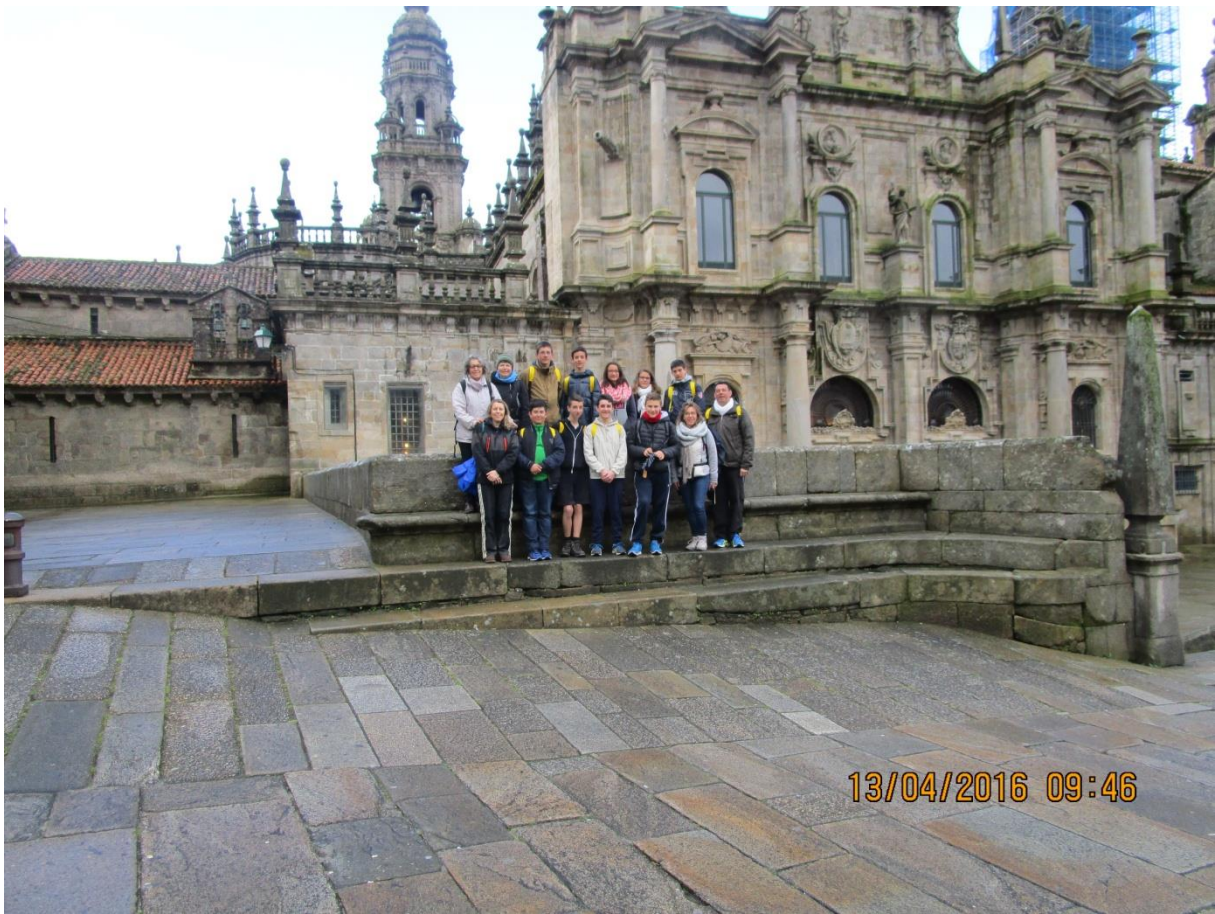
Puis notre arrivée à SANTIAGO après avoir traversé des forêts d'eucalyptus mémorables...