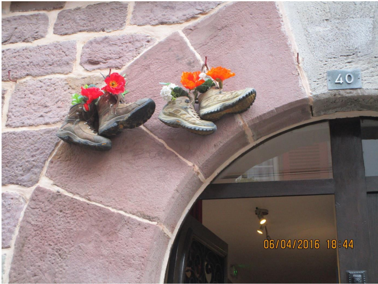
Le bureau des pèlerins à Saint Jean-Pied-de-Port avec remise des crédentiales