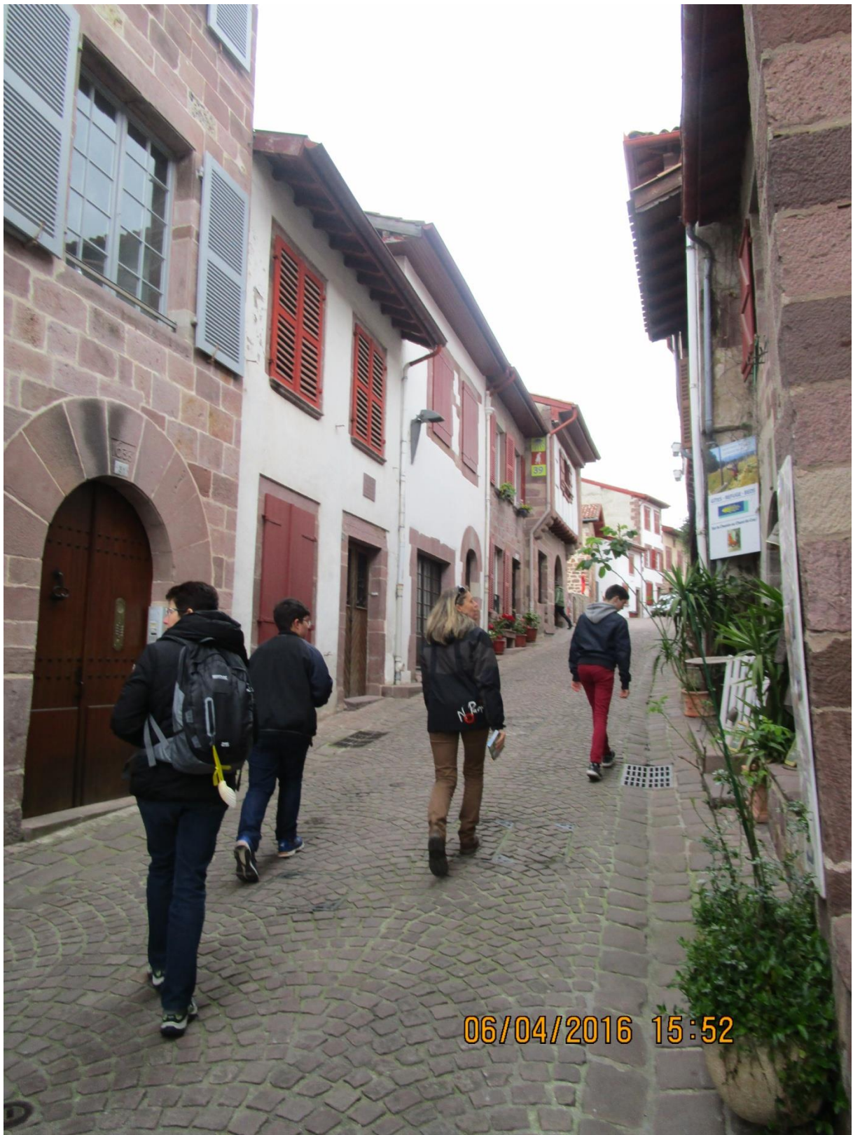
Les ruelles de Saint-Jean-Pied-de-Port