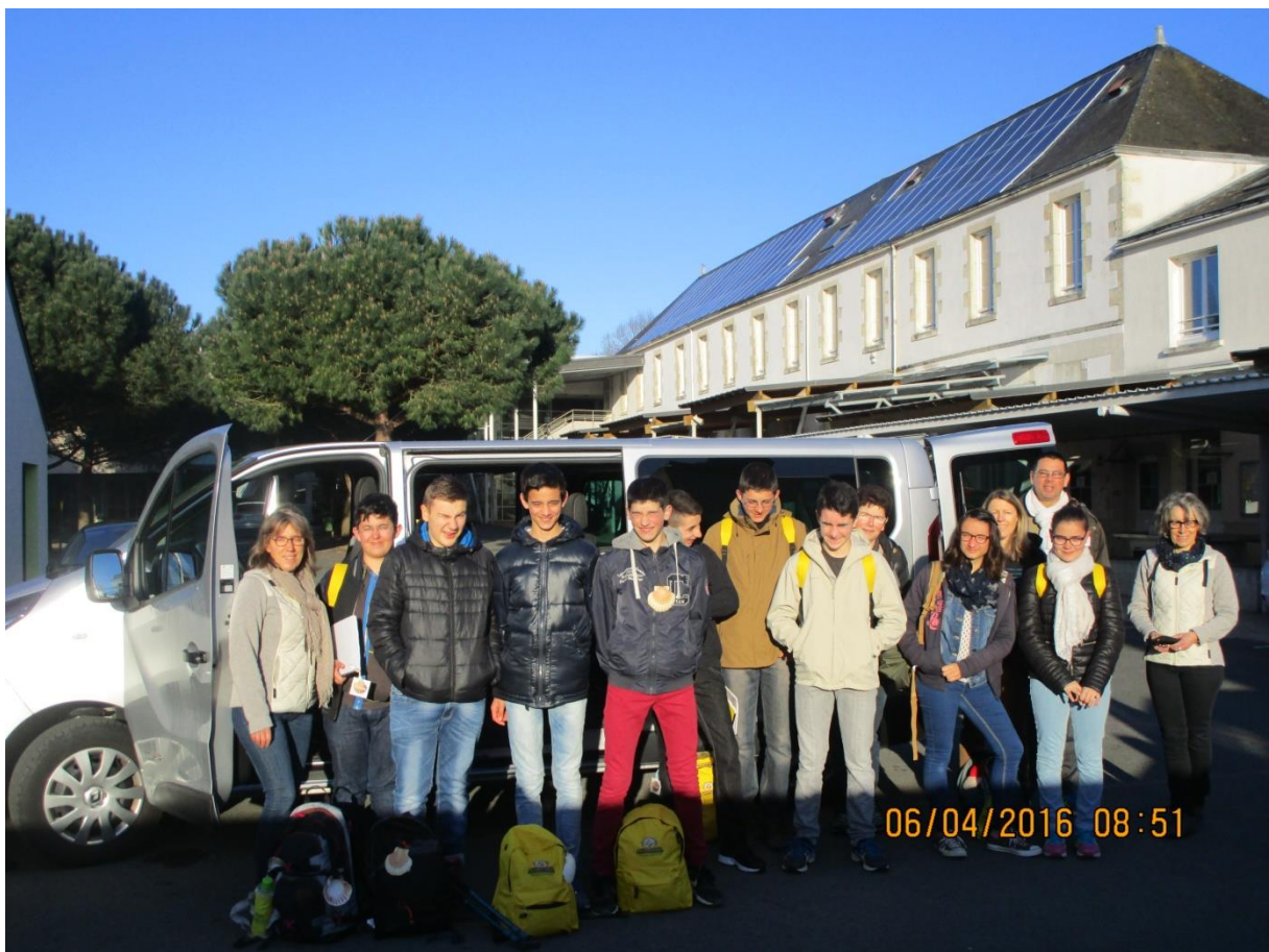
Départ de Chantonnay le mercredi 6 avril

Le rendez-vous est déjà pris dans 2 ans si tout va bien !